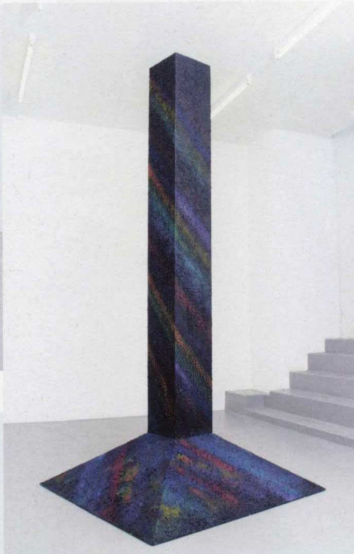
Sans titre (colonne), 2006